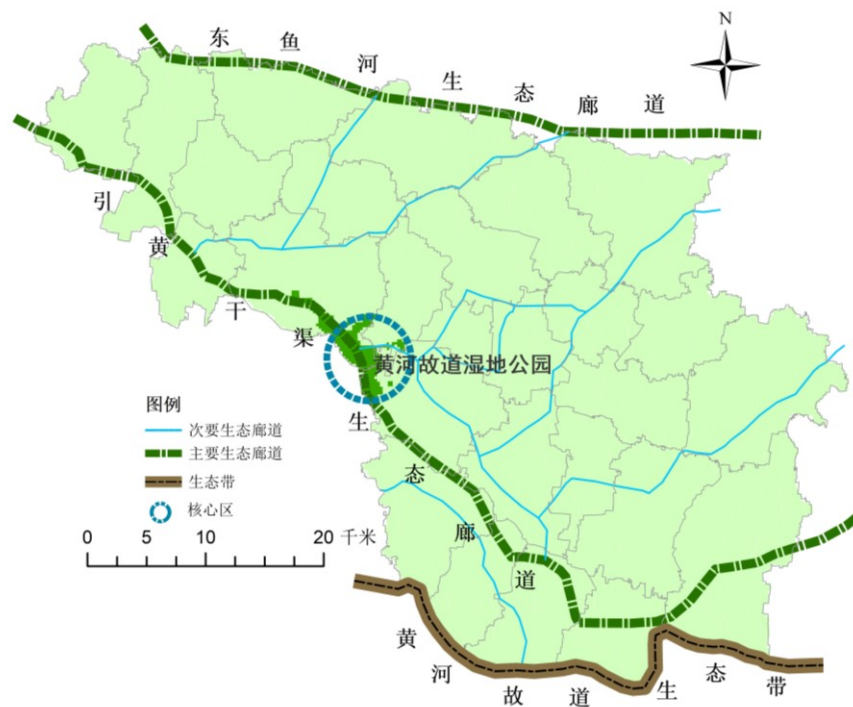
图 1 生态修复格局图